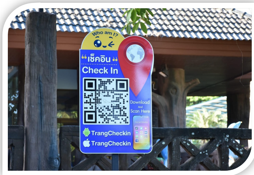
ภาพที่ ๑ ภาพป้าย Check In ติดตั้งบริเวณพิพิธภัณฑ์