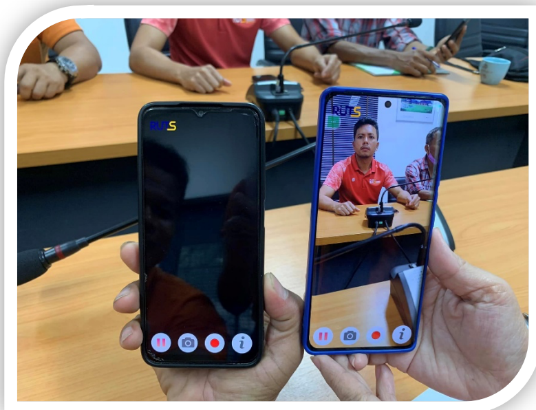
ภาพที่ ๓ การเปรียบเทียบข้อจำกัดในโทรศัพท์บางรุ่นที่ไม่รองรับระบบปฏิบัติการ