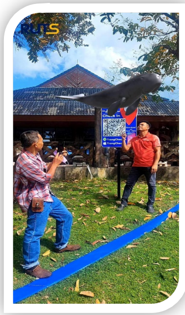
ภาพที่ ๔ ทดลองการใช้งานแอปพลิเคชัน กับเซ็คคิน VR สัตว์ทะเลหายาก